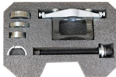
VKN 600: montaje sencillo y rápido de rodamientos HBU 2.1 sin necesidad de retirar la mangueta del vehículo.