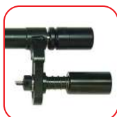
xC- Con copa para sujeción en otro tornillo (incluido)