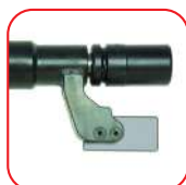
xB- Con barra de reacción