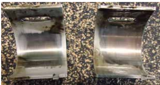
Casquillos desgastados en los que se incluso se aprecia el cobreado de la pieza.