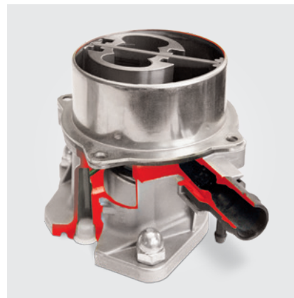
El estado actual de la técnica: Bomba de vacío monopaleta (modelo en corte)

Reutilización de una bomba de vacío usada en un motor reacondicionado: Las bombas de vacío están unidas al motor y se acoplan al sistema de aceite del motor, dependiendo del tipo de construcción. Tras una avería en el motor puede pasar que: